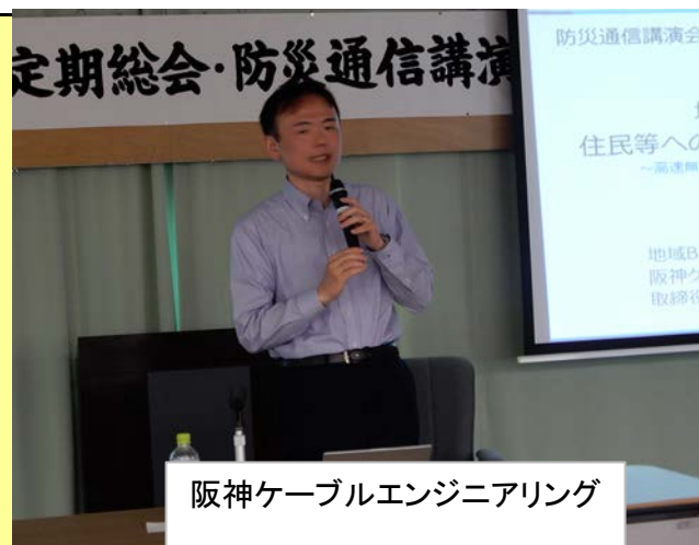
阪神ケーブルエンジニアリング