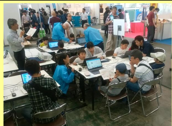
プログラミングワークショップ