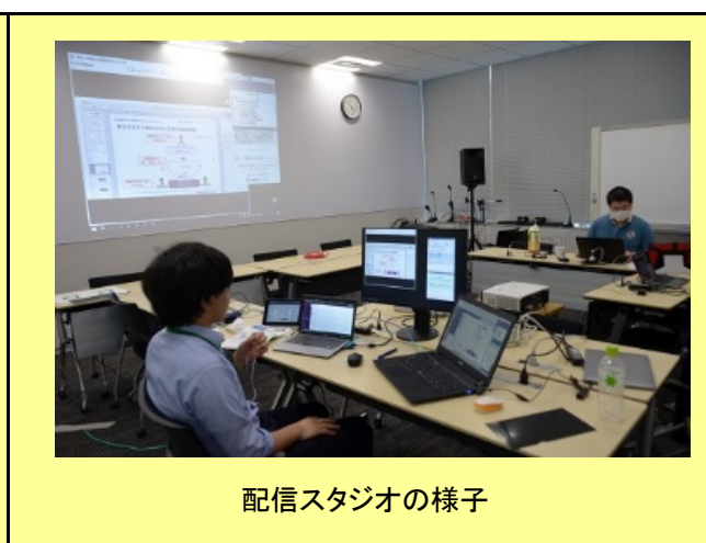
配信スタジオの様子