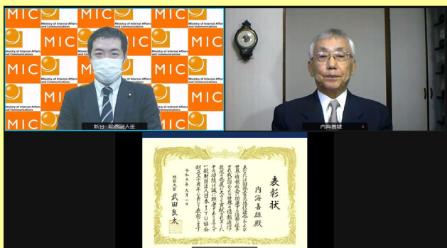
新谷総務副大臣より内海善雄氏へ総務大臣賞贈呈