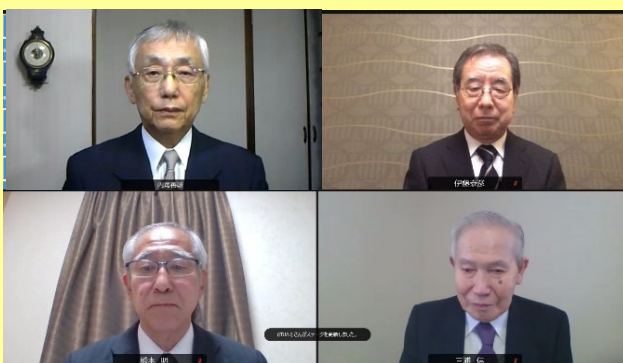
総務大臣賞受賞者